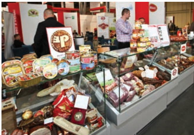
Ekspozycja „Mięso z Polski”